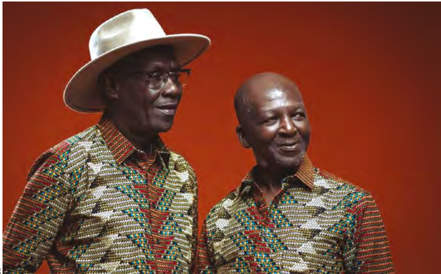
Depuis 1997, des convictions intactes et de la musique inséparable d'un engagement pour la diversité des cultures et la paix

SAMEDI 30 JUIN • 17H À 19H • ESPACE DÉBATS