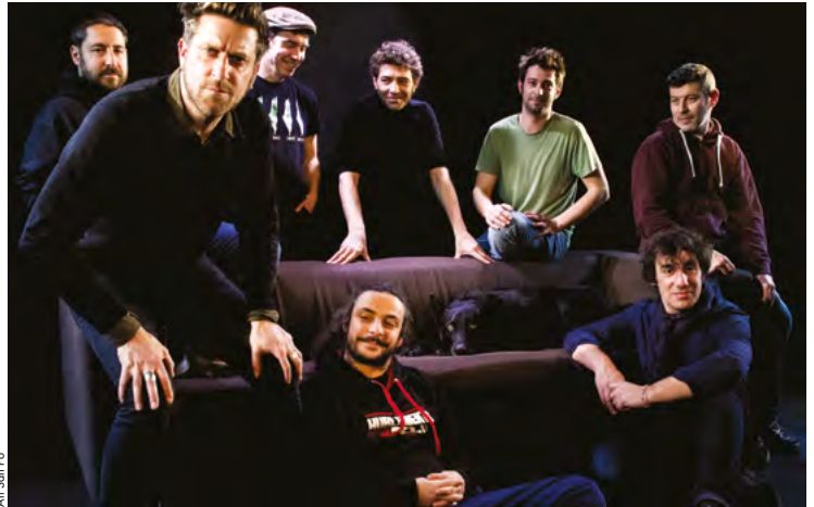
« Luna del Papel », leur dixième album, est le fruit d'un financement participatif.