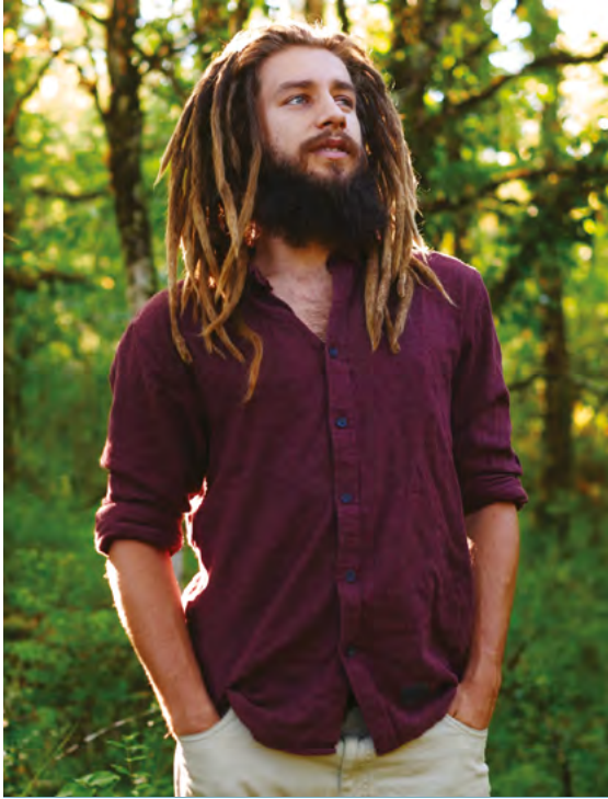
Au départ, la Nouvelle-Calédonie. Et le monde entier aujourd'hui.